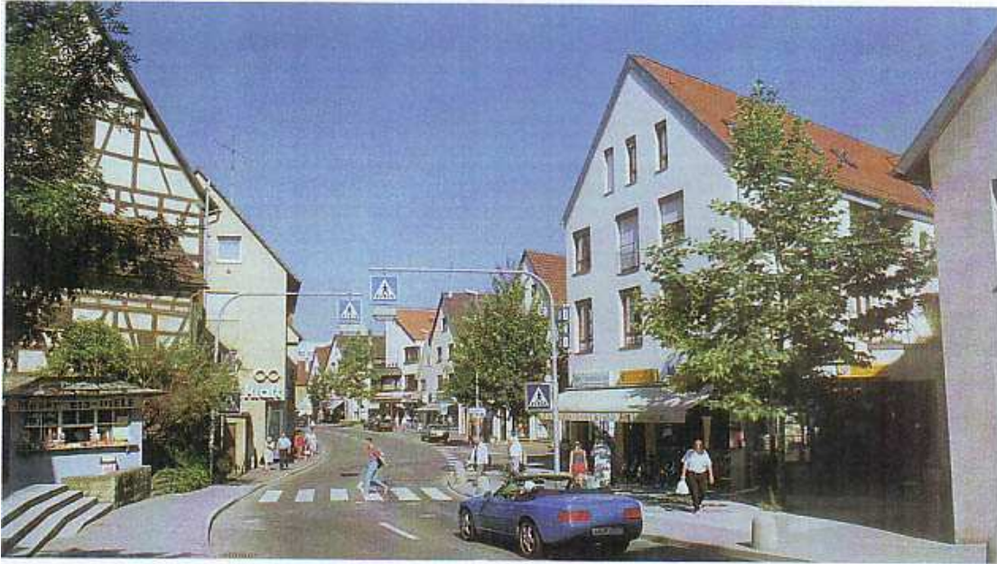
Markstraße in Ditzingen (Ditzingen S. 19.) Anhang 5