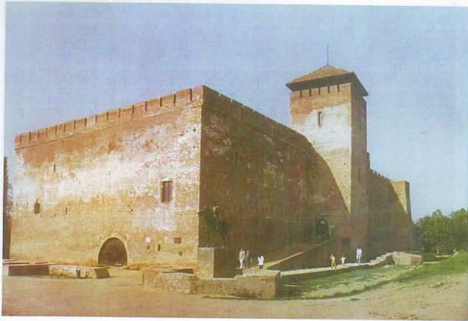
Gyulaer Burg (Gyula Früher und heute, S. 9) Anhang 3