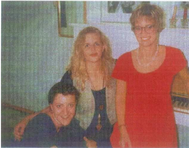
Musikalische Soiree im Jahre 1994. (eine Karte von meiner Tante) Anhang 2