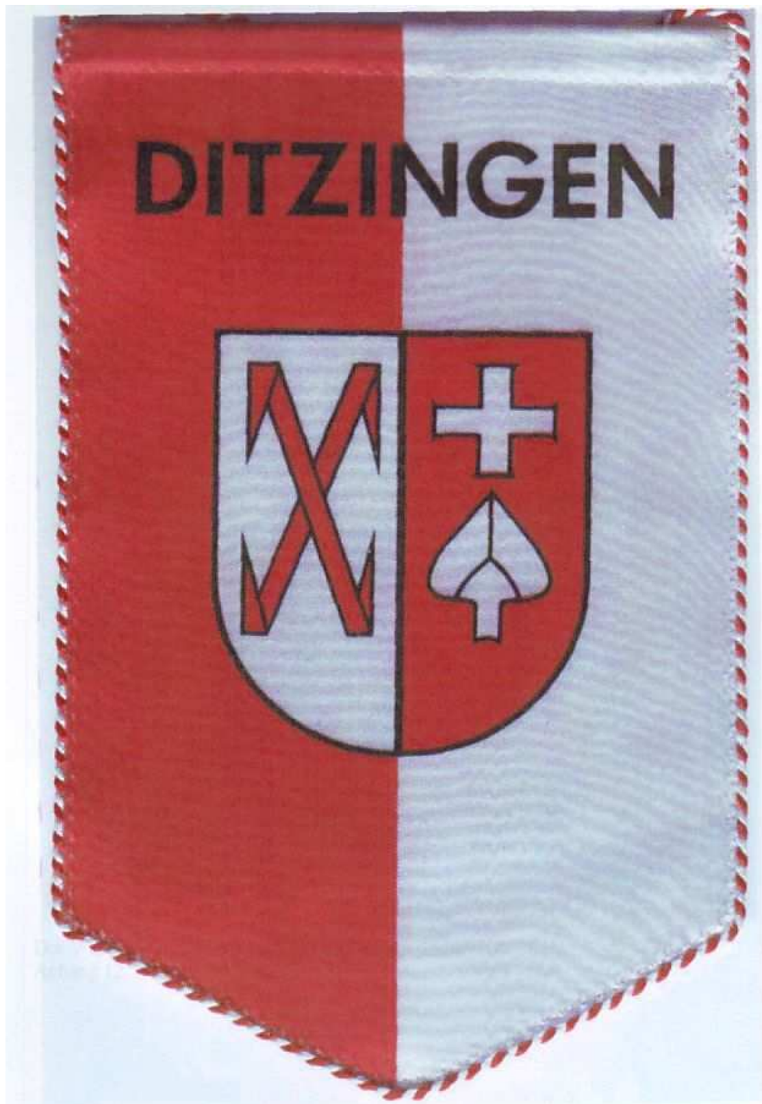
Der Wappen von Ditzingen (von meiner Tante) Anhang 11.