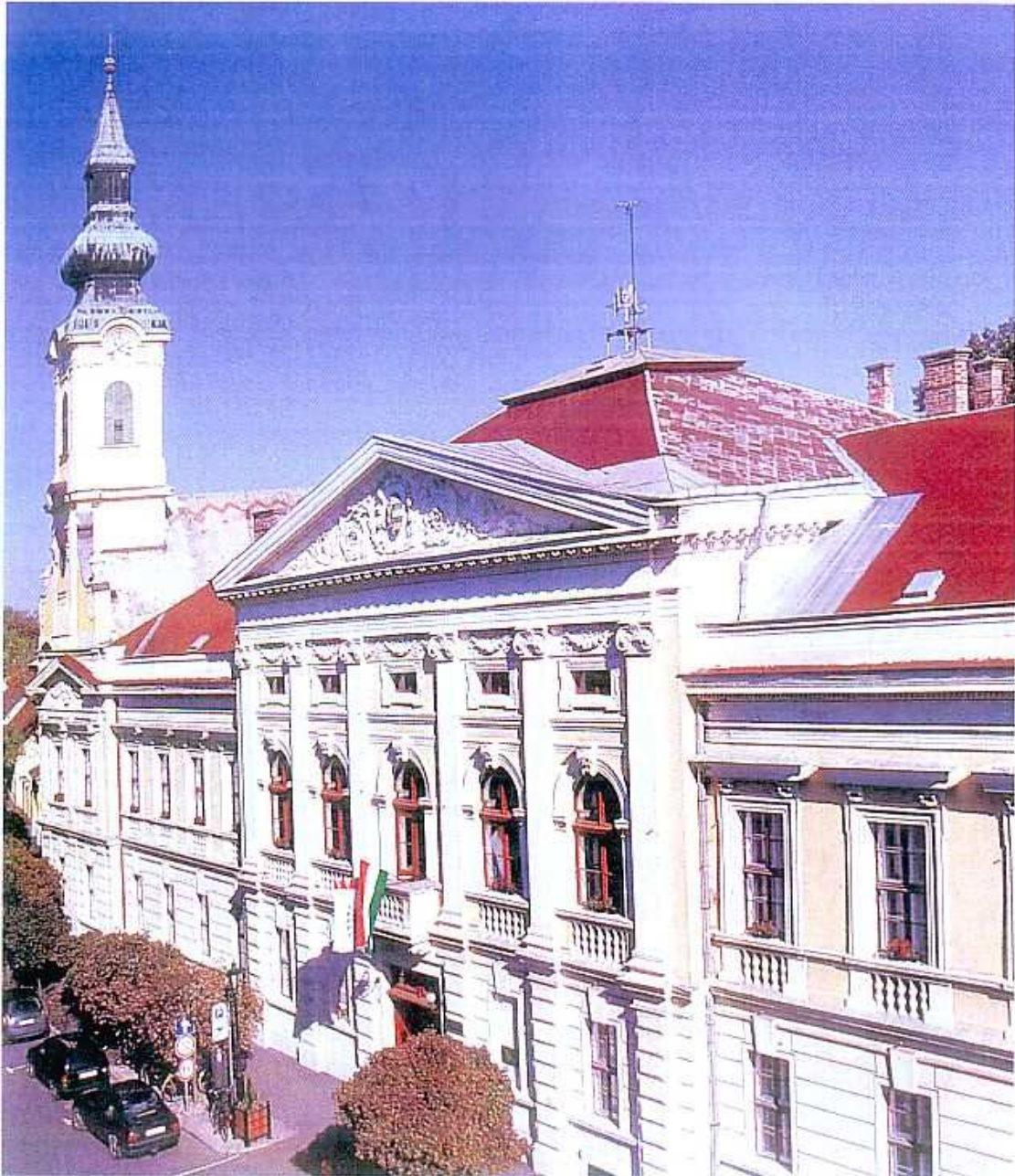
Das Bürgermeisteramt in Gyula (Gyula Früher und heute S. 66) Anhang 10.