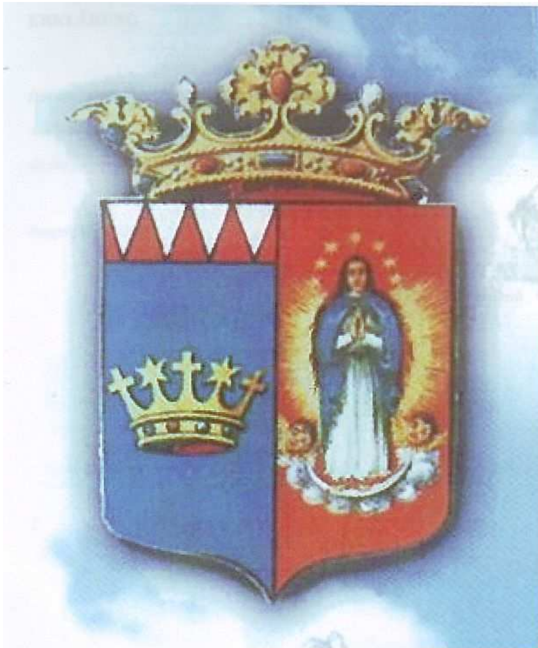
Der Wappen von Gyula/Jula Anhang 12.