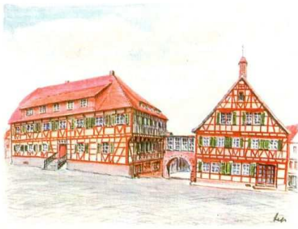
Das Dreigiebelhaus in Ditzingen (eine Karte von meiner Tante) Anhang 1